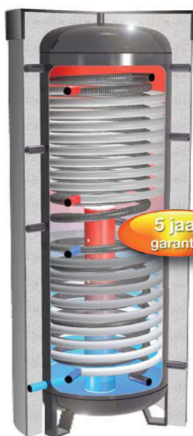
Afbeelding toont SKS-2-R