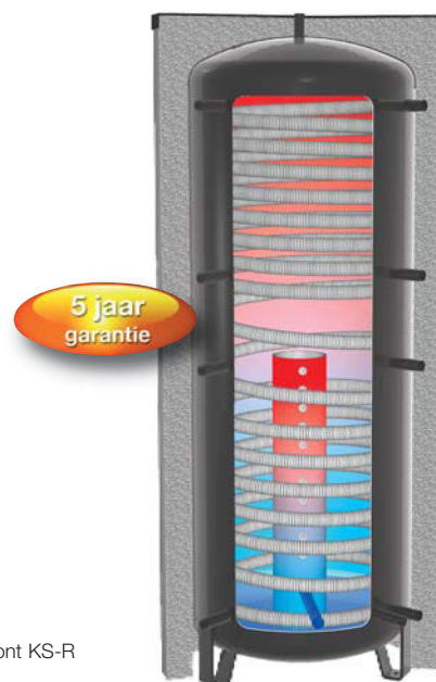
Afbeelding toont KS-R

Uitvoeringen: type KS, type KS-R met geïntegreerde gelaagde terugloopbuis en stromingsbochten en type WP-KS voor gebruik met warmtepompen (enkel leverbaar in grootte 600, 825 en 1000/790).