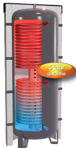
Afbeelding toont PSW-2/PSW-2-R

Optie: kijkgat – speciale uitvoeringen altijd mogelijk. Uitvoeringen: type PS, type PS-R met geïntegreerde gelaagde terugloopbuis en stromingsbochten.